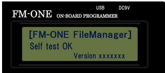
図 1-1 旧本体