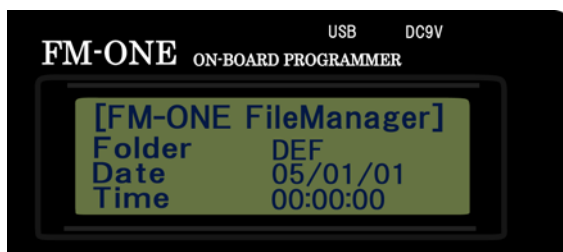
図 3-1 旧本体