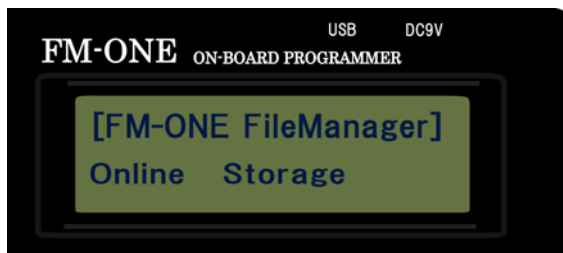
図 2-1 旧本体